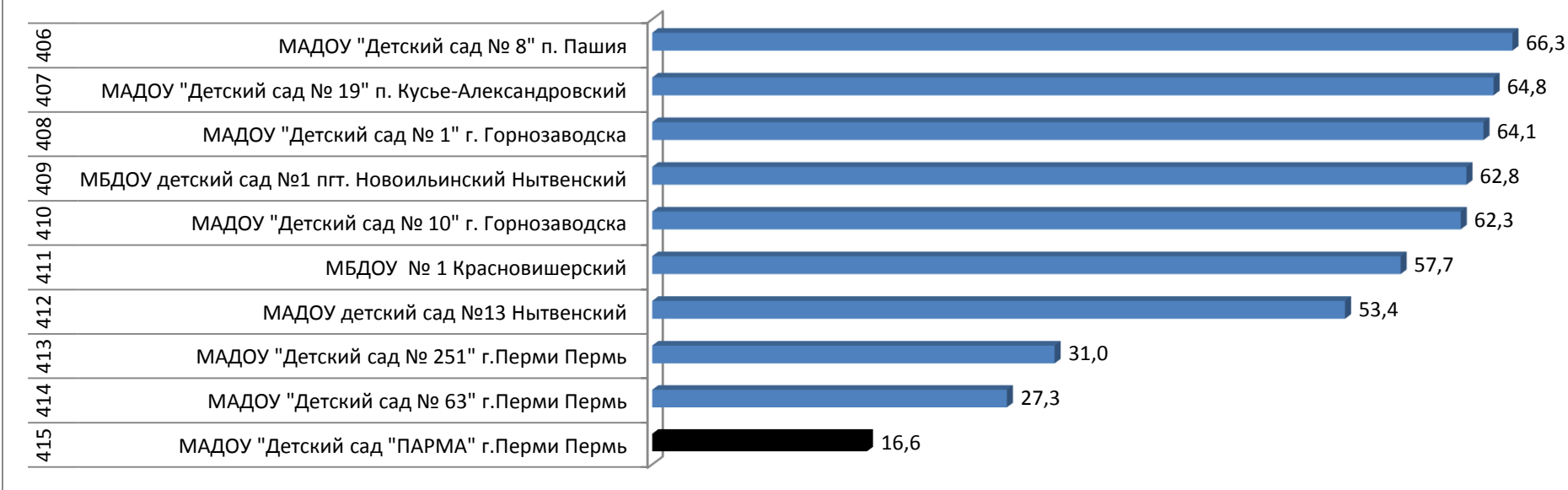
Диаграмма 2. Аутсайдеры рейтинга ДОУ 2019 года